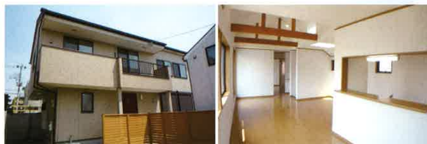
■ アクセスマップ 国立市富士見台3丁目19-3